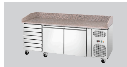
► Grand plan de travail en granit