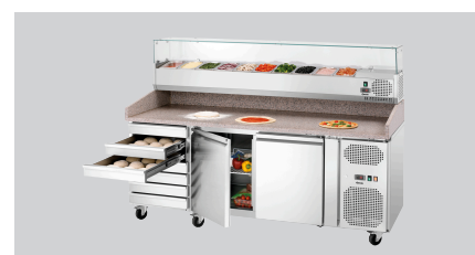
► Peut parfaitement être combiné avec le pré-sentoir réfrigéré GL3-2005