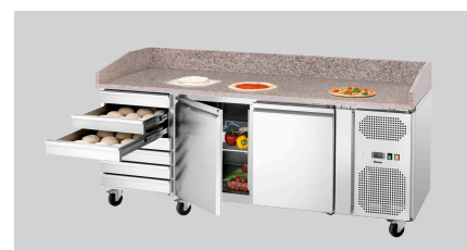
► Equipée de : ✓ 7 tiroirs pour pâtons ✓ 1 armoire réfrigérée avec 2 portes