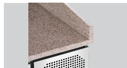
► Avec bord replié sur 3 côtés