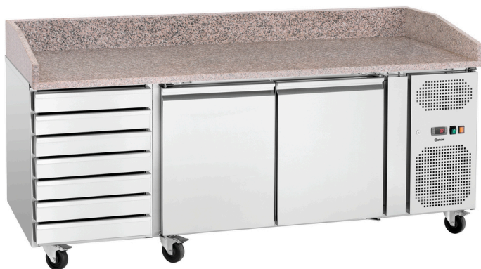
Table à pizza réfrigérée G-S7T2